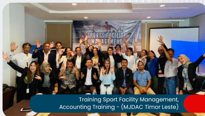
Training Sport Facility Management, Accounting Training - (MJDAC Timor Leste)