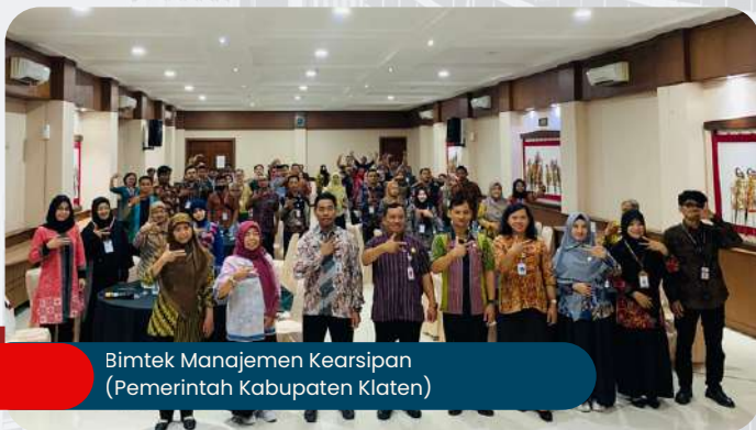
Bimtek Manajemen Kearsipan (Pemerintah Kabupaten Klaten)