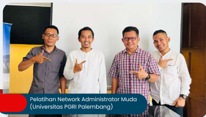
Pelatihan Network Administrator Muda (Universitas PGRI Palembang)