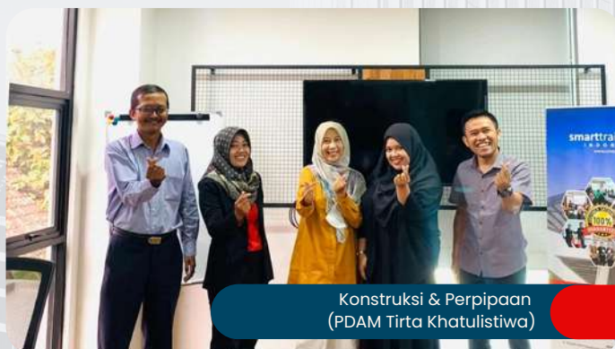
Konstruksi & Perpipaan (PDAM Tirta Khatulistiwa)