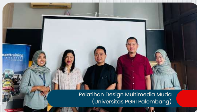
Pelatihan Design Multimedia Muda (Universitas PGRI Palembang)