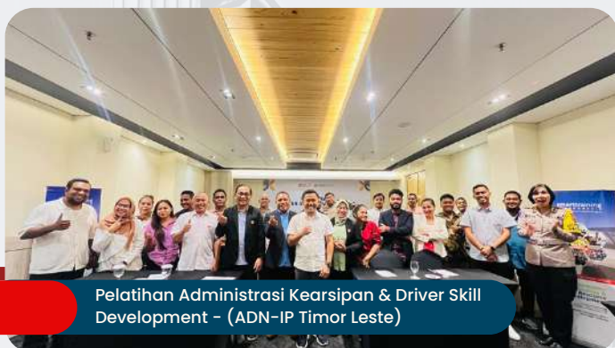
Pelatihan Administrasi Kearsipan & Driver Skill Development - (ADN-IP Timor Leste)