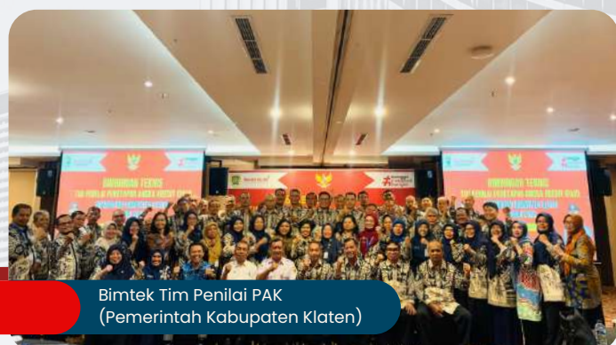
Bimtek Tim Penilai PAK (Pemerintah Kabupaten Klaten)