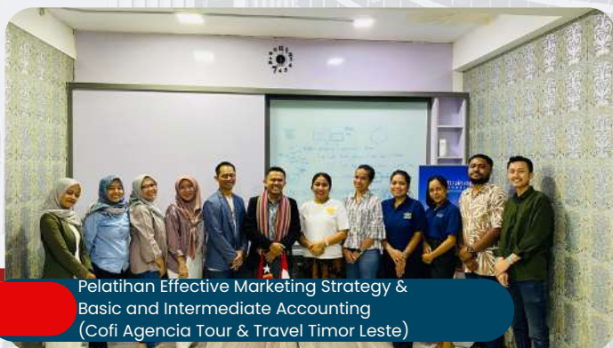
Pelatihan Effective Marketing Strategy & Basic and Intermediate Accounting (Cofi Agencia Tour & Travel Timor Leste)