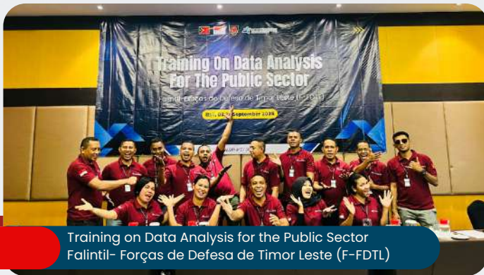
Training on Data Analysis for the Public Sector Falintil- Forças de Defesa de Timor Leste (F-FDTL)