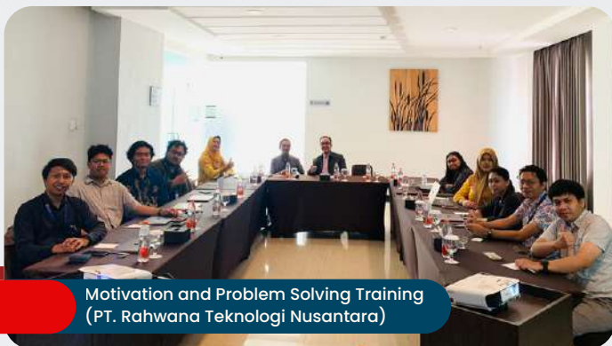
Motivation and Problem Solving Training (PT. Rahwana Teknologi Nusantara)