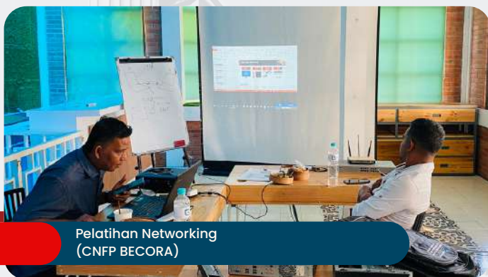
Pelatihan Networking (CNFP BECORA)