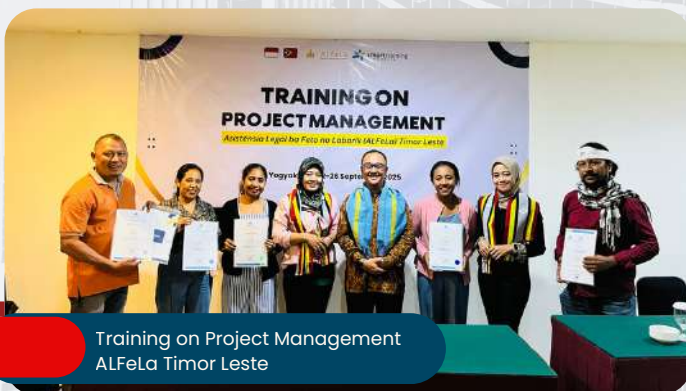
Training on Project Management ALFeLa Timor Leste