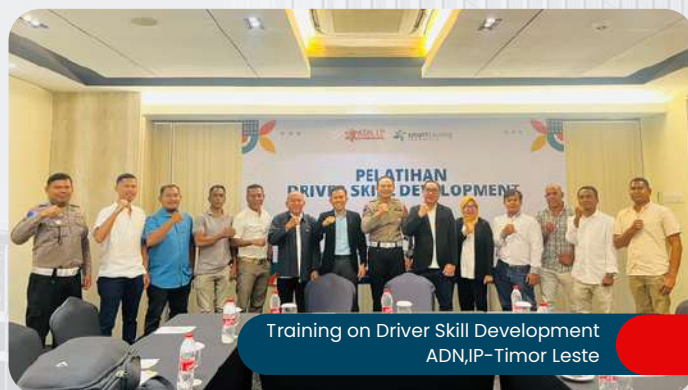
Training on Driver Skill Development ADN,IP-Timor Leste