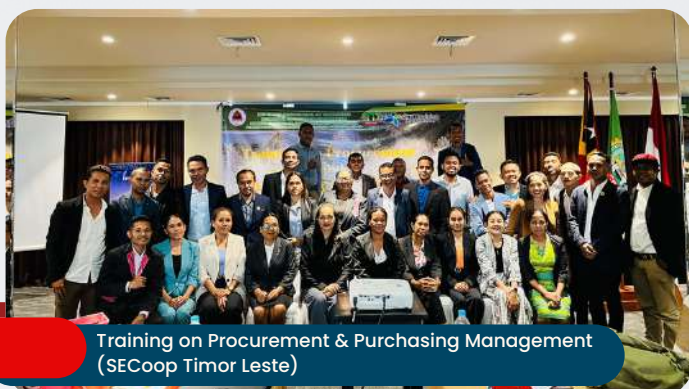
Training on Procurement & Purchasing Management (SECoop Timor Leste)