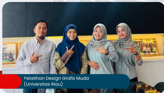
Pelatihan Design Grafis Muda (Universitas Riau)