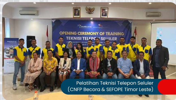
Pelatihan Teknisi Telepon Seluler (CNFP Becora & SEFOPE Timor Leste)