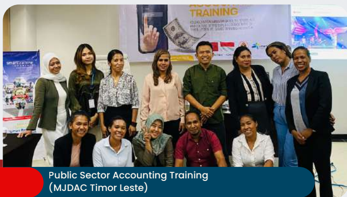
Public Sector Accounting Training (MJDAC Timor Leste)