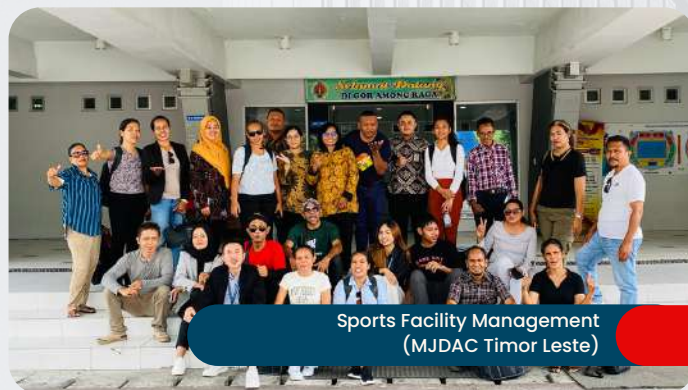
Sports Facility Management (MJDAC Timor Leste)