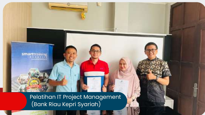
Pelatihan IT Project Management (Bank Riau Kepri Syariah)