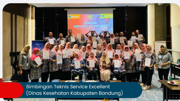
Bimbingan Teknis Service Excellent (Dinas Kesehatan Kabupaten Bandung)