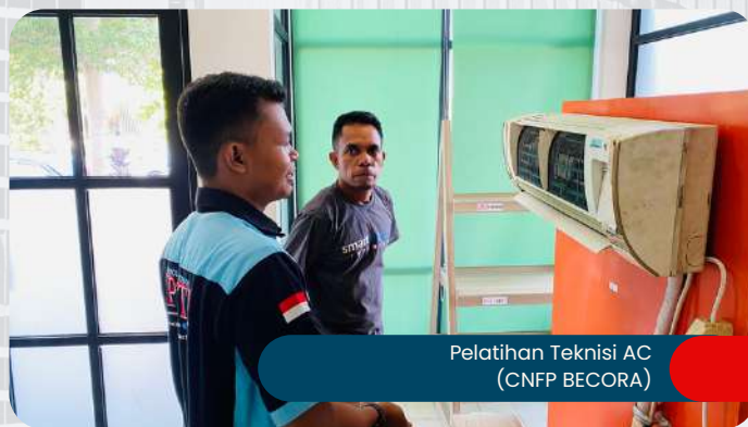
Pelatihan Teknisi AC (CNFP BECORA)