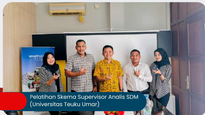
Pelatihan Skema Supervisor Analisis SDM (Universitas Teuku Umar)