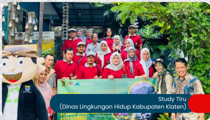
Study Tiru (Dinas Lingkungan Hidup Kabupaten Klaten)