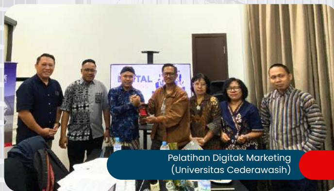
Pelatihan Digital Marketing (Universitas Cederawasih)