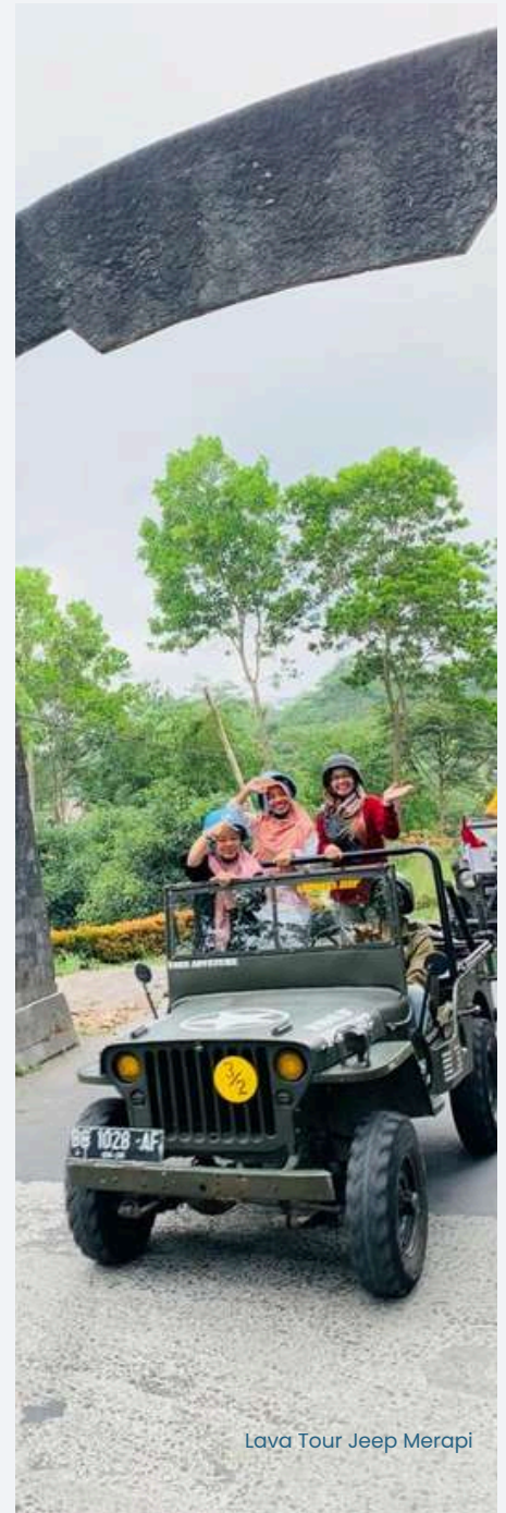
Lava Tour Jeep Merapi