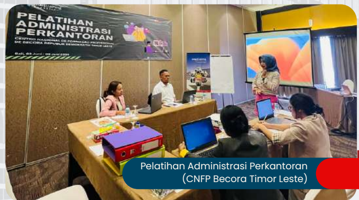
Pelatihan Administrasi Perkantoran (CNFP Becora Timor Leste)