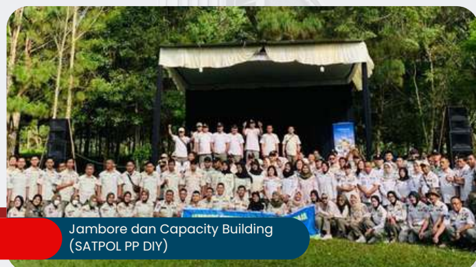
Jambore dan Capacity Building (SATPOL PP DIY)