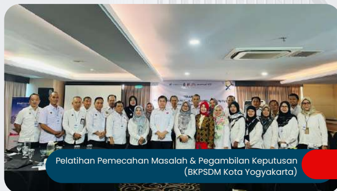
Pelatihan Pemecahan Masalah & Pegambilan Keputusan (BKPSDM Kota Yogyakarta)