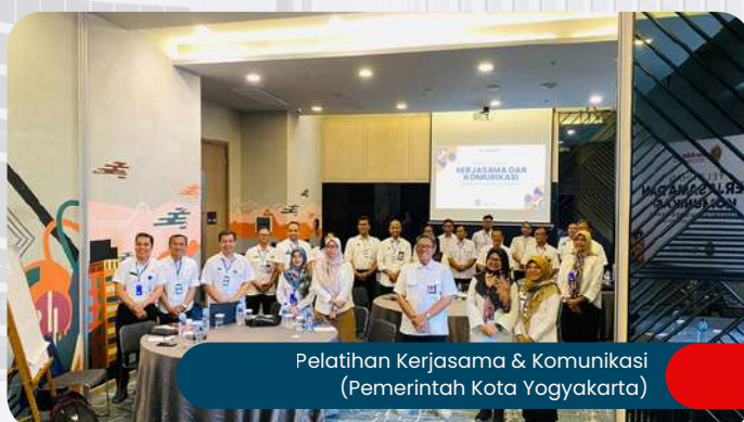
Pelatihan Kerjasama & Komunikasi (Pemerintah Kota Yogyakarta)