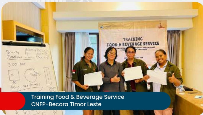
Training Food & Beverage Service CNFP-Becora Timor Leste