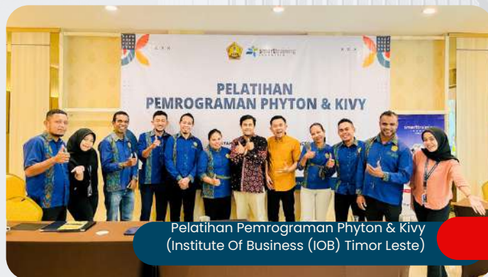
Pelatihan Pemrograman Phyton & Kivy (Institute Of Business (IOB) Timor Leste)