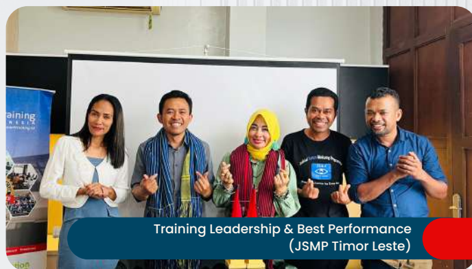
Training Leadership & Best Performance (JSMP Timor Leste)