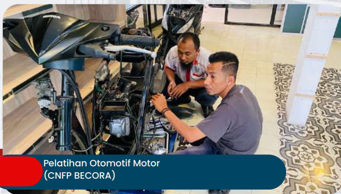
Pelatihan Otomotif Motor (CNFP BECORA)