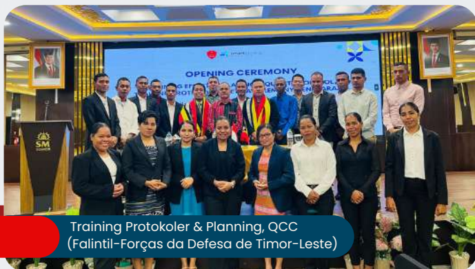
Training Protokoler & Planning, QCC (Falintil-Forças da Defesa de Timor-Leste)