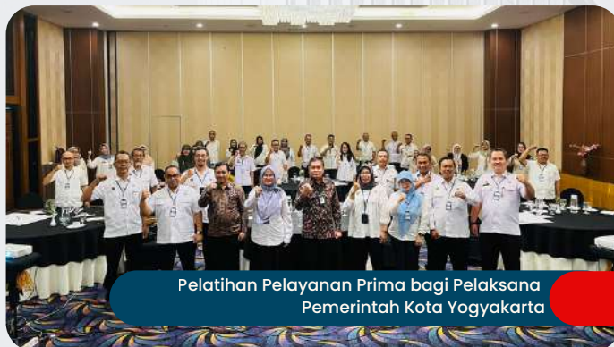
Pelatihan Pelayanan Prima bagi Pelaksana Pemerintah Kota Yogyakarta