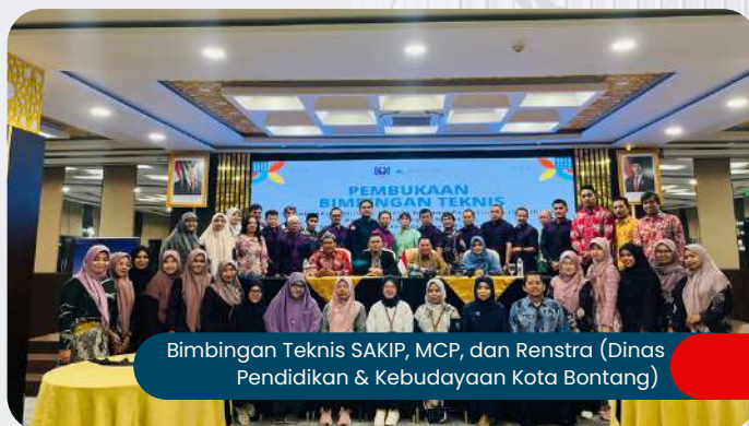
Bimbingan Teknis SAKIP, MCP, dan Renstra (Dinas Pendidikan & Kebudayaan Kota Bontang)