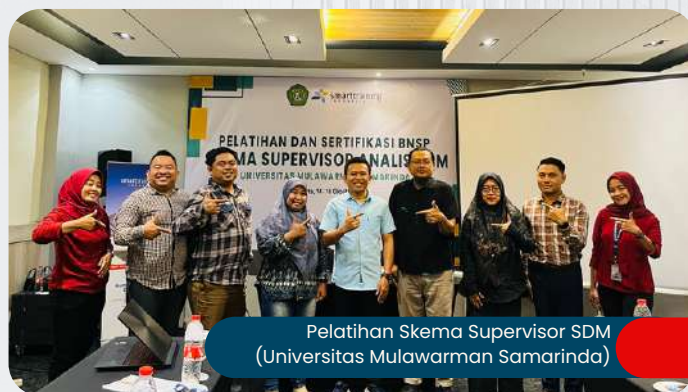
Pelatihan Skema Supervisor SDM (Universitas Mulawarman Samarinda)