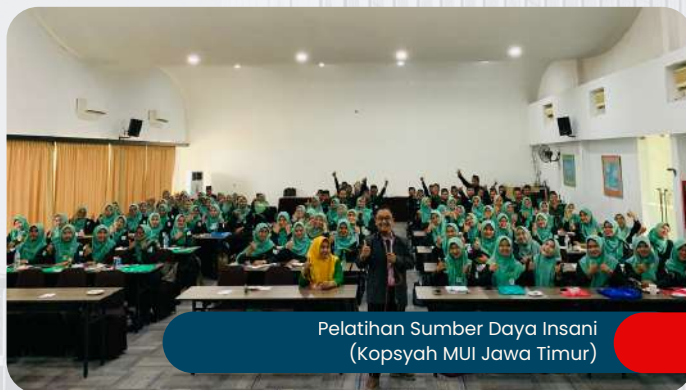
Pelatihan Sumber Daya Insani (Kopsyah MUI Jawa Timur)