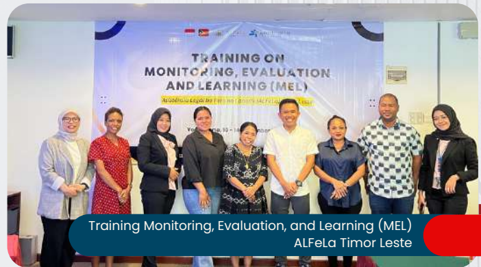
Training Monitoring, Evaluation, and Learning (MEL) ALFeLa Timor Leste