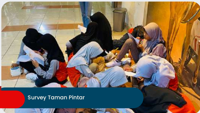
Survey Taman Pintar