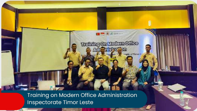
Training on Modern Office Administration Inspectorate Timor Leste