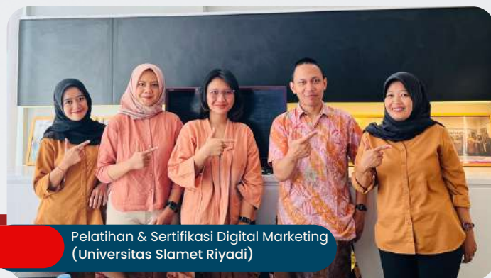
Pelatihan & Sertifikasi Digital Marketing (Universitas Slamet Riyadi)