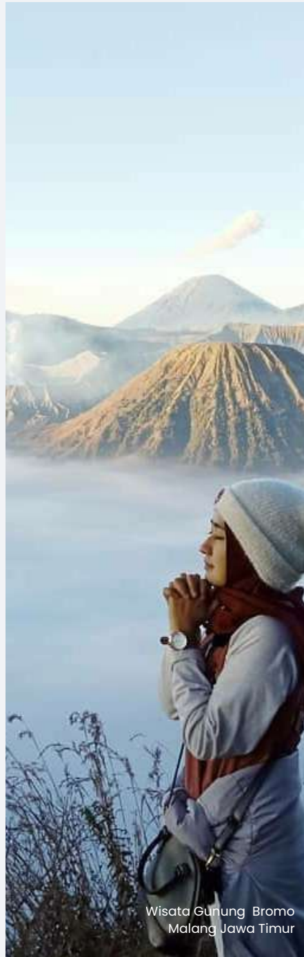
Wisata Gunung Bromo Malang Jawa Timur