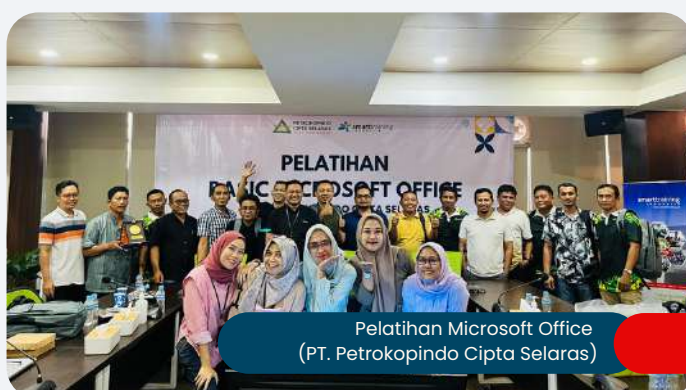
Pelatihan Microsoft Office (PT. Petrokopindo Cipta Selaras)