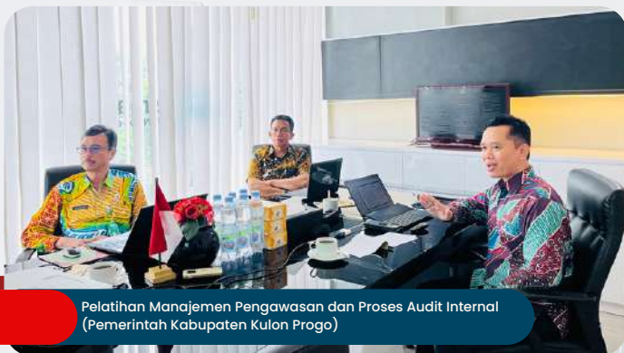
Pelatihan Manajemen Pengawasan dan Proses Audit Internal (Pemerintah Kabupaten Kulon Progo)