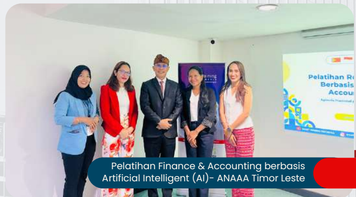
Pelatihan Finance & Accounting berbasis Artificial Intelligent (AI)- ANAAA Timor Leste