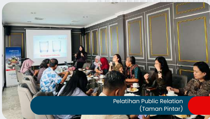
Pelatihan Public Relation (Taman Pintar)