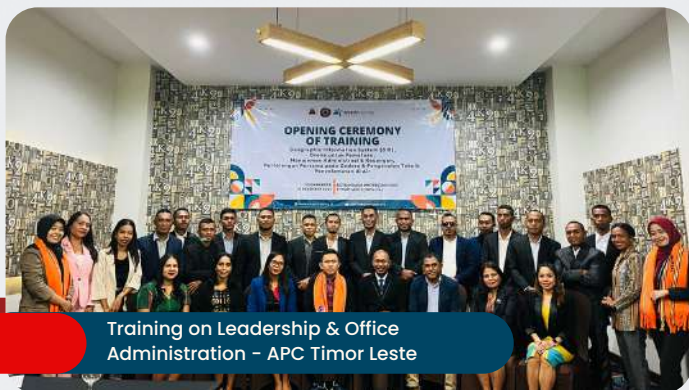
Training on Leadership & Office Administration - APC Timor Leste