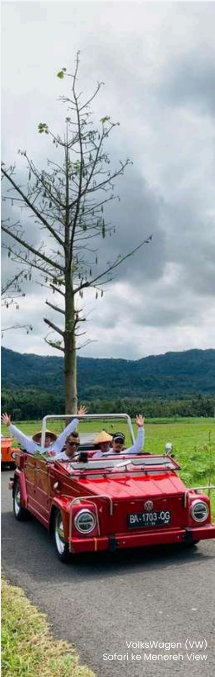
Volkswagen (VW) Safari ke Menoreh View