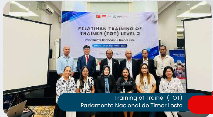
Training of Trainer (TOT) Parlamento Nacional de Timor Leste